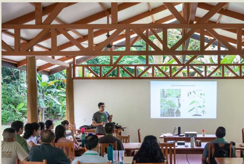
Figura 4. El Think Tank Catalizando Acciones para la Conservación de Árboles a través de Centroamérica incluyó presentaciones de expertos, sesiones de trabajo y salidas a campo a través de 4 días en el Campus de Conservación Osa.

de experiencias, datos y colaboraciones. Dada la urgencia, la amplitud y el limitado financiamiento del trabajo de la comunidad conservacionista, son escasas las ocasiones para conectar a quienes llevan a cabo actividades similares a nivel regional, nacional e incluso local. Esta falta de comunicación lleva en muchos casos a