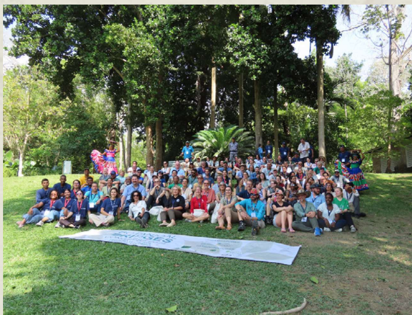
Figura 3. Participantes en el congreso Botanical Bridges 2024 en Cartagena, Colombia.

y organizaciones dedicadas a la conservación vegetal en la región del Caribe y América Central. La Red fomenta un ambiente colaborativo donde se comparten conocimientos, recursos y experiencias que ayudan al fortalecimiento de capacidades para proteger la flora de la región. La Red valora profundamente los esfuerzos de sus miembros, cuyas acciones están estrechamente alineadas con la Estrategia de Conservación Vegetal para la región del Caribe . Esta estrategia establece un conjunto de acciones enfocadas en la conservación de plantas, respaldando el Marco Mundial de Biodiversidad de Kunming-Montreal (2022-2030), con el objetivo de detener la continua pérdida de diversidad vegetal y enfatizando la importancia de revertir esta tendencia.