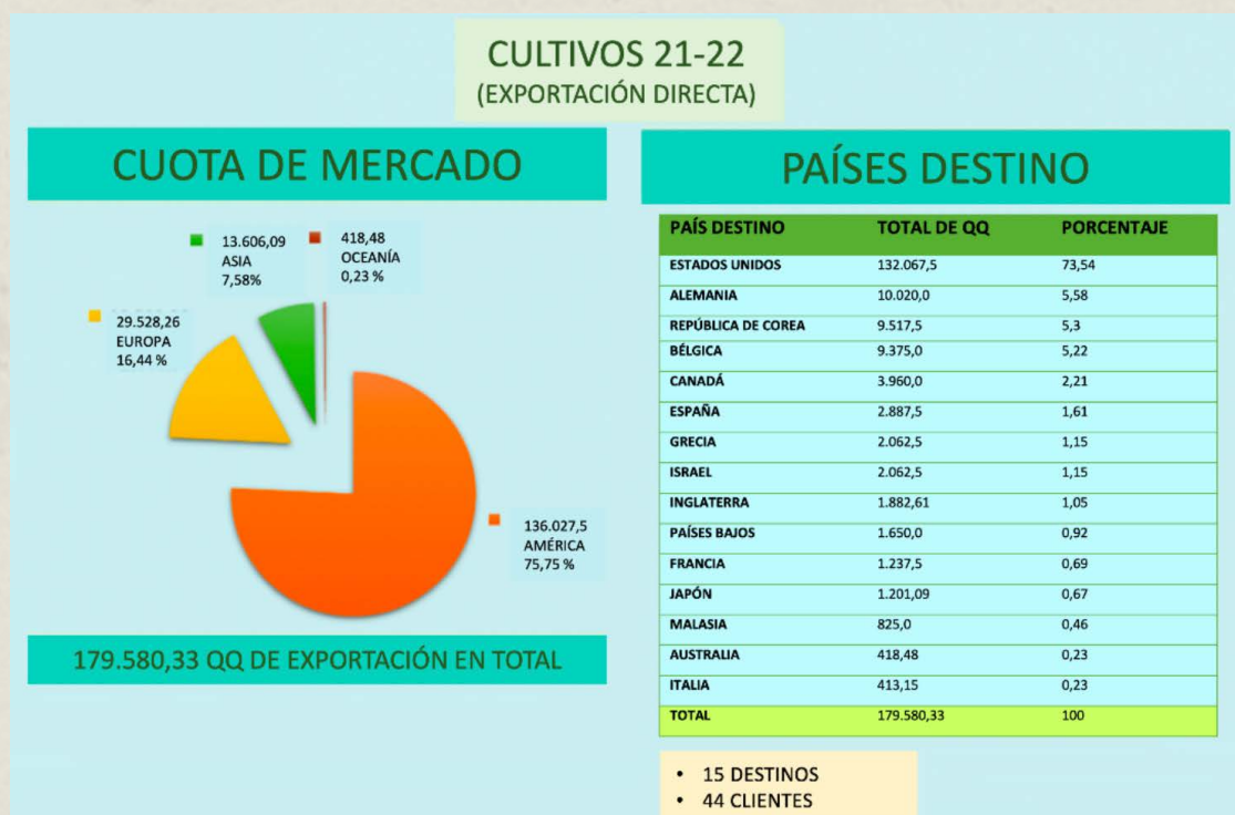
Figura 4. Principales mercados de exportación de la Cooperativa de productores de Tarrazú - COOPETARRAZU R.L.

Evidenciar los esfuerzos realizados en la rama de la agroforestería en nuestros cafetales, sumados a los existentes, es también una extraordinaria oportunidad para que esas familias cafetaleras que dieron un paso adelante y resiliente, puedan ver reconocido un esfuerzo que ha valido la pena, recibiendo el pase para comercializar su café en el mercado europeo bajo esos atributos.