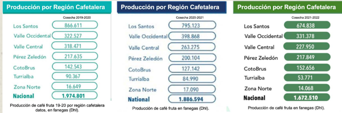
Figura 1. Producción cafetalera por regiones, cosechas 2019-2020, 2020-2021 y 2021-2022.

familiares en donde el 85 % son pequeños, evidenciado la importancia de atender toda acción externa que pueda poner en riesgo el bienestar de estos grupos familiares ( Figura 2 ).