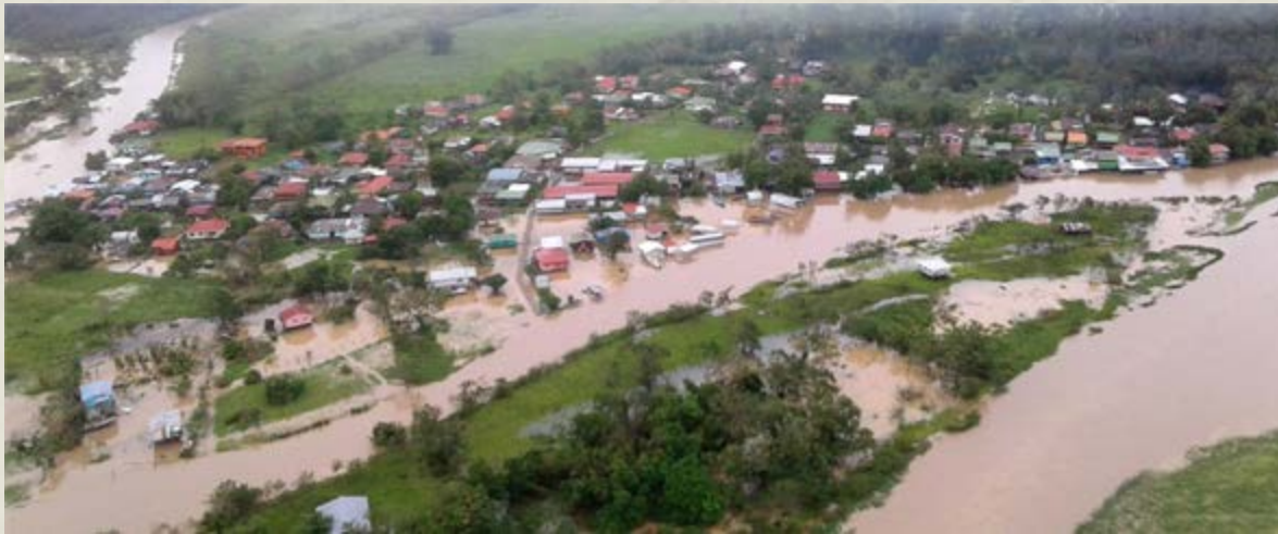
Figura 3. La comunidad de Barra Norte luego del paso del huracán Otto, Refugio Nacional de Vida Silvestre Barra del Colorado (Sitio Ramsar Caribe Noreste), Pococí, Limón, Costa Rica. Fotografía: Olman Mena, funcionario Área de Conservación Tortuguero-SINAC, 2016.

manglares y praderas marinas los tipos de humedales que cuentan con este servicio ecosistémico de almacenamiento de grandes cantidades de carbono. Para el caso de las turberas, estas contienen aproximadamente el 30 % de todo el carbono almacenado en las zonas terrestres.