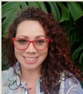
Coordinadora Programa Nacional de Humedales y Punto Focal nacional ante la Convención de Ramsar ( jacklyn.rivera@sinac. go.cr )