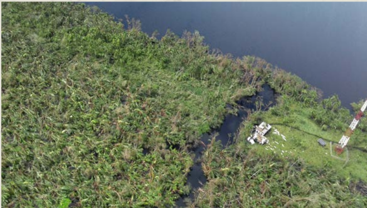
Figura 2. Puesto de Policía de Portillos, ubicado en el RNVS Barra del Colorado (Sitio Ramsar Caribe Noreste), 2017. Pococí, Limón, Costa Rica.

de aguas fue alto y provocó inundación en estos pueblos, pero dentro de límites normales para la zona, que fue protegida por el Humedal Caribe Noreste en el sector fronterizo. Las zonas externas a las áreas silvestres protegidas no mostraron indicios de afectación; cultivos como banano, piña, palma africana mostraron condiciones normales, al igual que potreros y bosques hacia el suroeste de la costa.