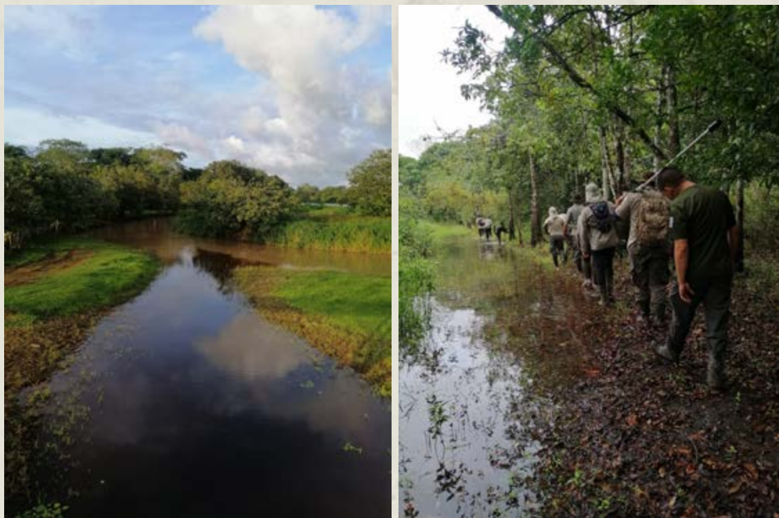
Figura 1. Vista panorámica del sistema lagunar del Refugio nacional de Vida Silvestre Mixto Caño Negro, Humedal de importancia internacional y funcionarios del Área de Conservación Arenal Huetar Norte en capacitación para la identificación de suelos hidromórficos asociados a humedal; Alajuela, Costa Rica, 2021.

1998, y dos décadas después (2018) se logra contar con información tan valiosa como el área que cubren en el territorio nacional los sistemas palustres, lacustres y una porción de los estuarinos, resultando en 307 315.99 hectáreas. Esta cobertura representa el 6 % del territorio continental en el país, excluyendo así su área marina.