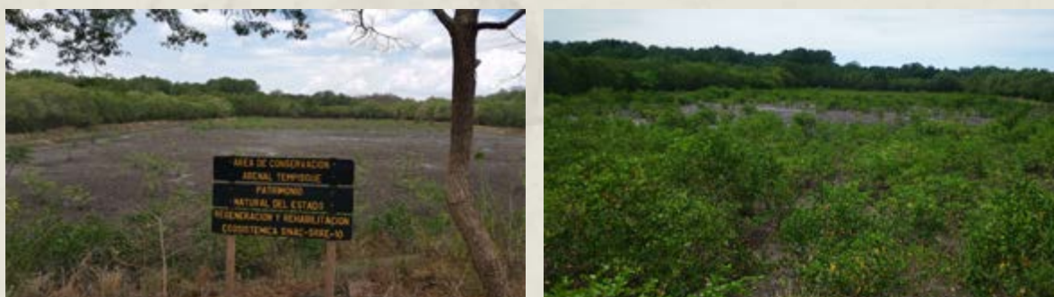
Figura 4. Avances visibles de restauración de manglares en áreas de antiguos permisos de uso mediante un enfoque integral en los humedales de Nispero y San Buenaventura-Colorado (fechas de las fotografías: mayo 2020 - mayo 2021). Guanacaste, Costa Rica.

central para aplicar el Acuerdo de París, el cual pretende estabilizar y reducir las emisiones de gases de efecto invernadero (GEI) y limitar el aumento de la temperatura media mundial en este siglo por debajo de los 2 °C. Así que, las NDC son planes climáticos nacionales que destacan acciones climáticas. Incluyen objetivos, políticas y medidas relacionados con el clima que los gobiernos se proponen implementar en respuesta al cambio climático y como contribución a la acción climática mundial y para el caso de Costa Rica, se han asumido compromisos para conservar y restaurar los humedales, mejorar la aplicación de planes de gestión de los humedales, incluidos planes de restauración de estos, evitar la pérdida o modificación de las características ecológicas y poner en marcha los procesos y zonas prioritarias para la restauración de estos ecosistemas.