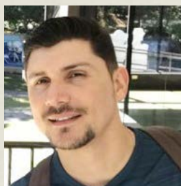
Funcionario de la Comisión Nacional de Prevención de Riesgos y Atención de Emergencias (CNE) (amata@cne.go.cr)