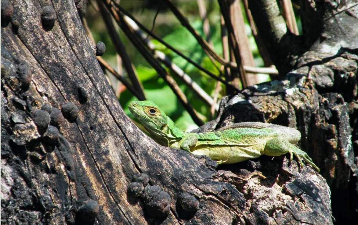
CCT. Reptil en Reserva Biológica San Luis.

como campamentos estudiantiles y giras escolares con niños de los centros educativos ubicadas en la comunidad.