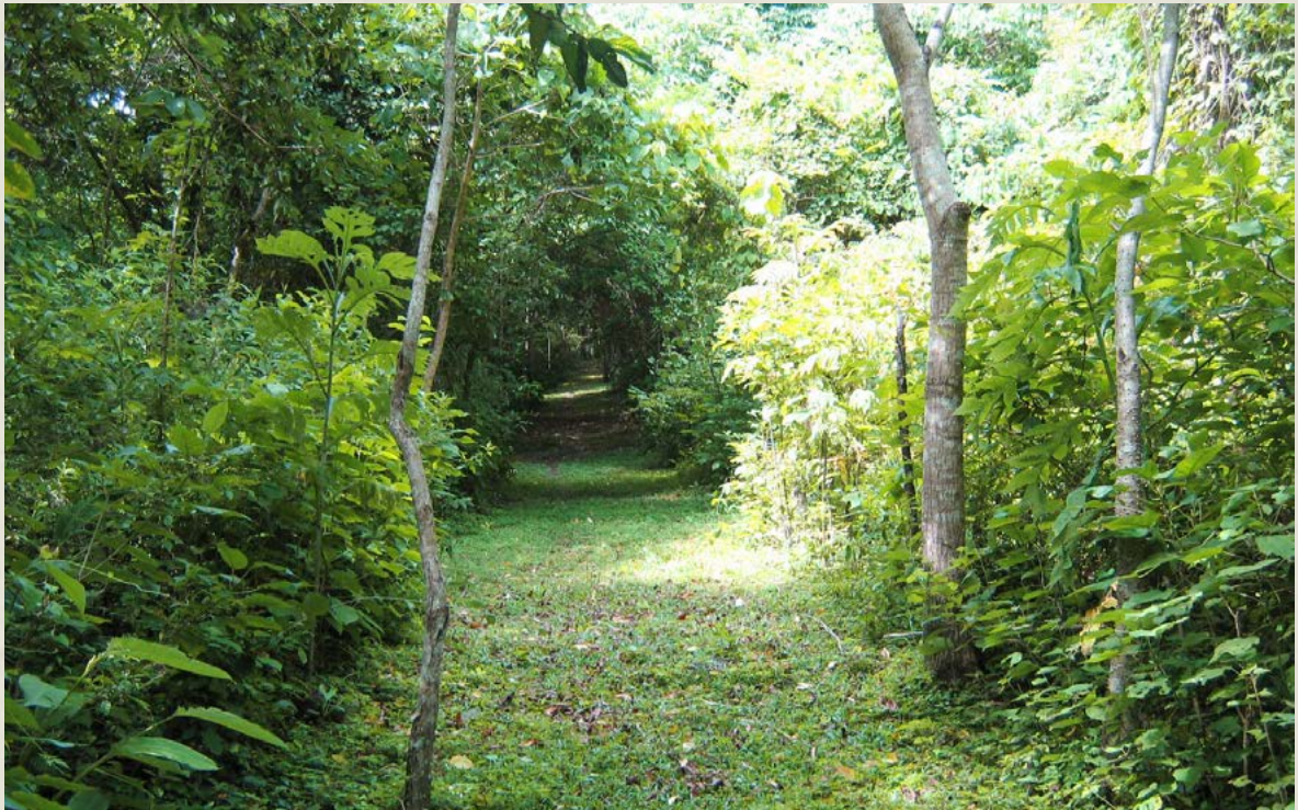
CCT. Reserva Biológica San Luis.