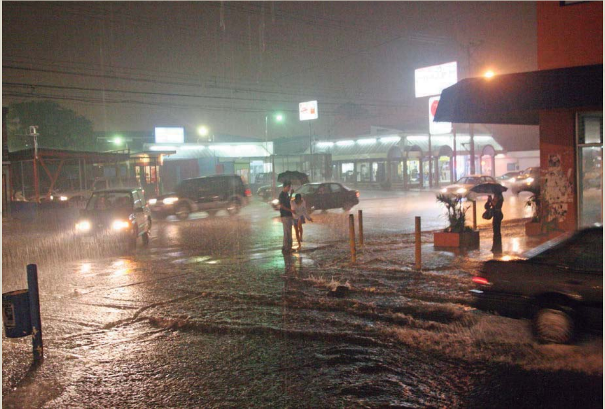
Alfredo Huerta. San Pedro, Costa Rica.

y prepararse para los cambios climáticos futuros. Entonces es válido plantear la interrogante: si aún no nos hemos adaptado a la variabilidad climática actual ¿Cómo esperamos adaptarnos al cambio climático futuro?